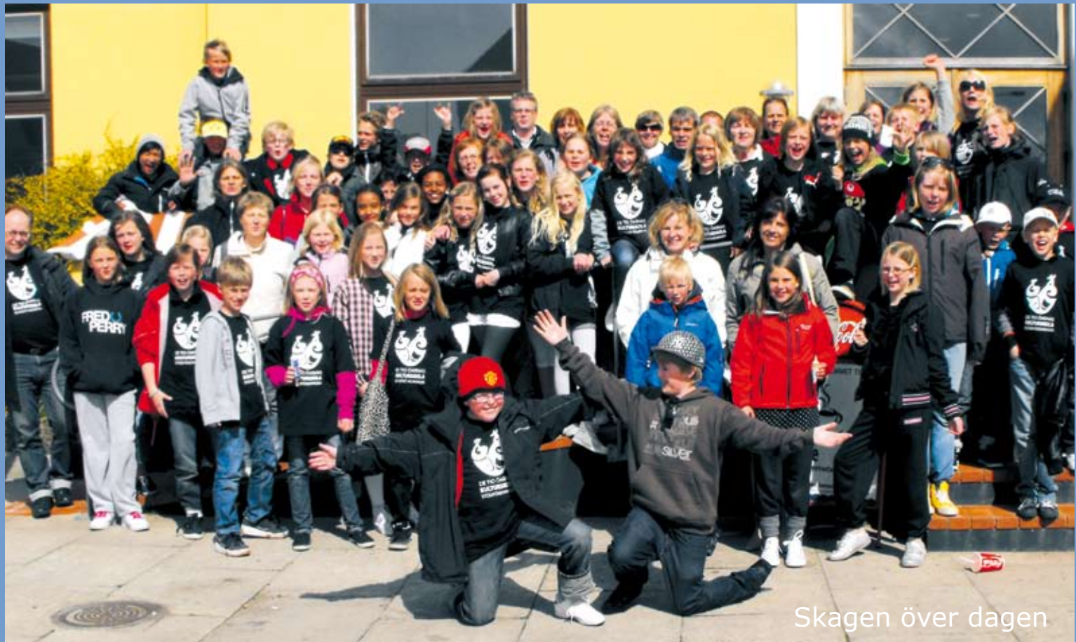
Skagen över dagen